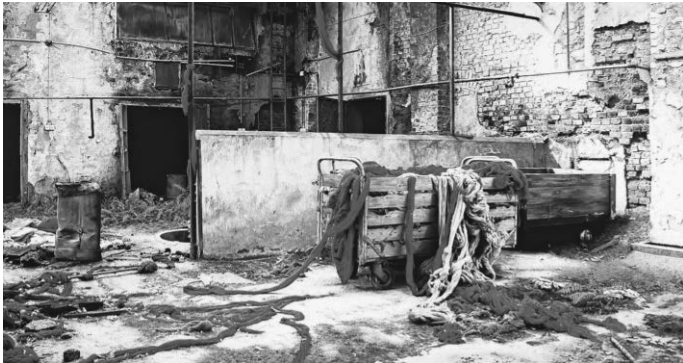
Stefan Bircheneder, Polyester, 2028, Öl auf Leinwand.

Info: Die Ausstellung „Schichtwechsel“ von Stefan Bircheneder in der Städtischen Galerie In der Badstube, Lange Gasse 9, in Wangen dauert bis 30. Juni. Sie ist dienstags bis freitags, sonntags und feiertags von 14 bis 17 Uhr, samstags von 11 bis 17 Uhr geöffnet. Alle weiteren Infos zum Begleitprogramm sind im Internet unter www.wangen.de erhältlich.